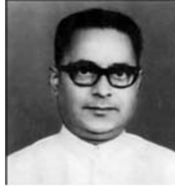
ಎಲ್ ಟಿ ಕಾರ್ಲೆ