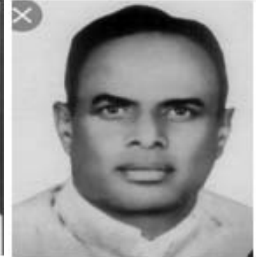
ಡಿ ಆರ್ ಕರಿಗೌಡ