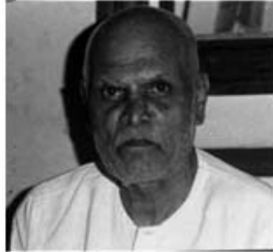
ಗೊರೂರು ರಾಮಸ್ವಾಮಿ ಅಯ್ಯಂಗಾರ್

ಸ್ವಾತಂತ್ರ್ಯ ಹೋರಾಟದಲ್ಲಿ ಕರ್ನಾಟಕ - ಗೊರೂರು / ೮೧