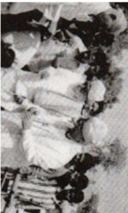
ಕಲಬುರಗಿಯಲ್ಲಿ ಶರಣಗೌಡರ ವೃತ್ತದ ಅಡಿಗಲ್ಲು ಸಮಾರಂಭದಲ್ಲಿ ಪೂಜ್ಯ ಶರಣಬಸವೇಶ್ವರ ಪೀಠಾಧಿಪತಿಗಳೊಂದಿಗೆ