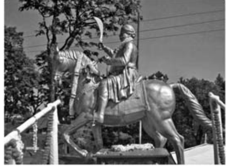
ಸ್ವಾತಂತ್ರ್ಯ ಹೋರಾಟಗಾರ ಸುಬೇದಾರ್ ಅಪ್ಪಯ್ಯಗೌಡರ ಪ್ರತಿಮೆ

ಸ್ವಾತಂತ್ರ್ಯ ಹೋರಾಟದಲ್ಲಿ ಕರ್ನಾಟಕ - ಮಡಿಕೇರಿ / ೪೯