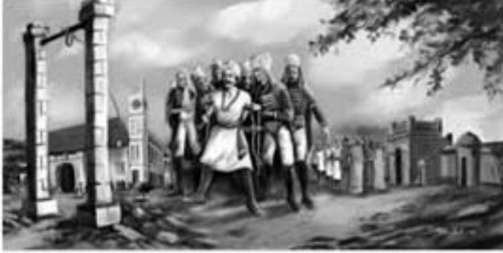
ಸ್ವಾತಂತ್ರ್ಯ ಸೇನಾನಿ ಸುಬೇದಾರ್ ಅಪ್ಪಯ್ಯಗೌಡರನ್ನು ಗಲ್ಲಿಗೇರಿಸುವ ಸಂದರ್ಭ