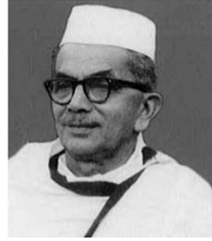
ಕೊಡಗಿನ ಗಾಂಧಿ ಪಾಂಡ್ಯಂಡ ಬೆಳ್ಳಿಯಪ್ಪನವರು

ಸ್ವಾತಂತ್ರ್ಯ ಹೋರಾಟದಲ್ಲಿ ಕರ್ನಾಟಕ - ಮಡಿಕೇರಿ / ೫೧