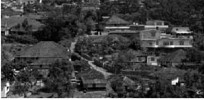
ಮಡಿಕೇರಿಯ ಒಂದು ನೋಟ

೪೮ / ಸ್ವಾತಂತ್ರ್ಯ ಹೋರಾಟದಲ್ಲಿ ಕರ್ನಾಟಕ - ಮಡಿಕೇರಿ