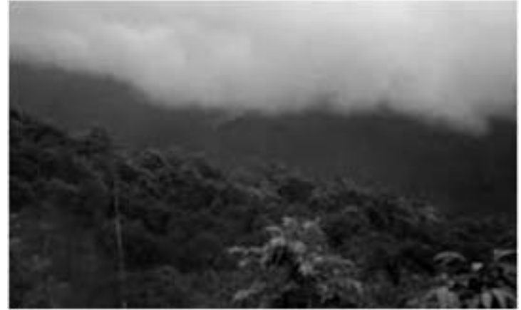
ಮಡಿಕೇರಿಯ ಪ್ರಕೃತಿಯ ಸೊಬಗು