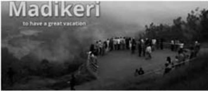
ಮಡಿಕೇರಿಯ ಮನೋಮೋಹಕ ದೃಶ್ಯದ ಒಂದು ನೋಟ

ಸ್ವಾತಂತ್ರ್ಯ ಹೋರಾಟದಲ್ಲಿ ಕರ್ನಾಟಕ - ಮಡಿಕೇರಿ / ೪೯