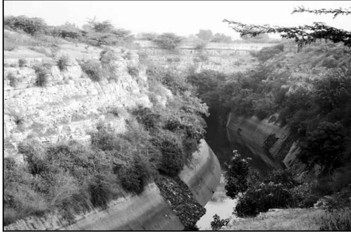
ಹುತಾತ್ಮ ಶ್ರೀ ವಿರೂಪಾಕ್ಷಪ್ಪಗೌಡರು ಹತ್ಯೆಯಾದ ಸ್ಥಳ- ಮೂಕಾರ್ತಿ ಬೆಟ್ಟ.