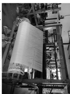
ನೇಯ್ಗೆ ವಿಭಾಗ, ತಗಡೂರು ಗ್ರಾಮ