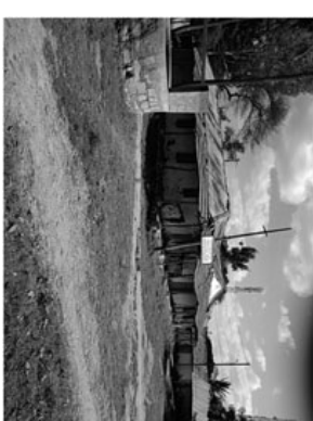
ಗಾಂಧಿ ಆಶ್ರಮ, ತಗಡೂರು