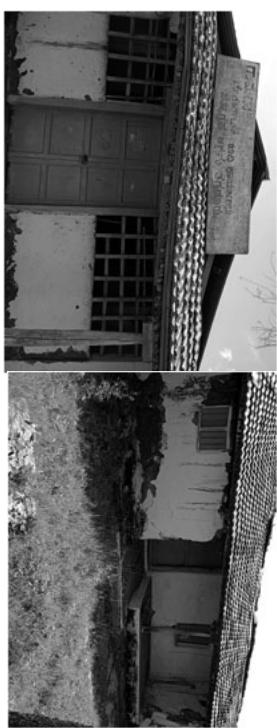
ಸತ್ಯಾಗ್ರಹ ಆಶ್ರಮ, ತಗಡೂರು ಸತ್ಯಾಗ್ರಹ ಆಶ್ರಮದ ಅವಧಿ, ತಗಡೂರು