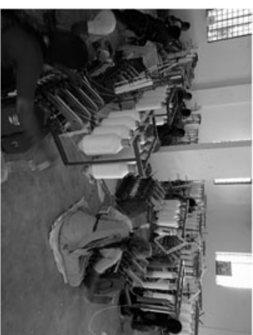
ಪ್ರಸ್ತುತ ನೂಲು ತೆಗೆಯುವ ಕಾರ್ಯಾಲಯದಲ್ಲಿ ಮಹಿಳೆಯರು, ತಗಡೂರು