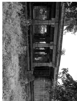
ಲಕ್ಕಿ ಕಾಂತ ದೇವಾಲಯ, ತಗಡೂರು