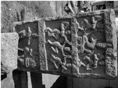
ಮೂಲಸ್ಥಾನೇಶ್ವರ ದೇವಾಲಯದ ಮುಂದಿರುವ ವಿರಗಲ್ಲು