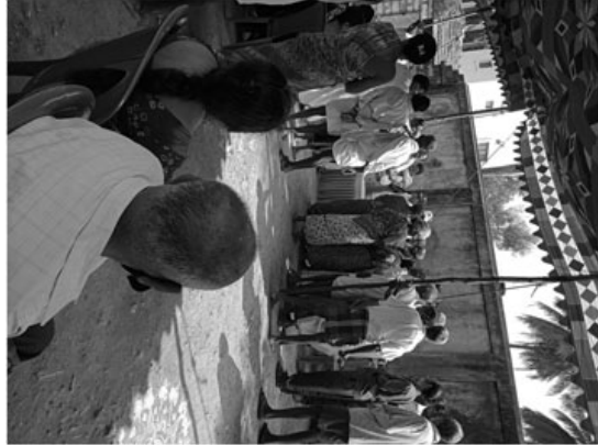
ಹಸುಮ ಜಯಂತಿಯಂದು ವಯೋವೃದ್ಧರಿಗೆ ಕಂಬಳಿ ವಿತರಿಸುತ್ತಿರುವುದು