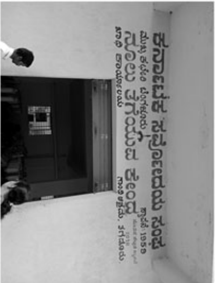
ಪ್ರಸ್ತುತ ಕಾರ್ಯಾಲಯ, ತಗಡೂರು