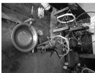
ಸೂಲುವುದು, ತಗಡೂರು ಆಶ್ರಮ