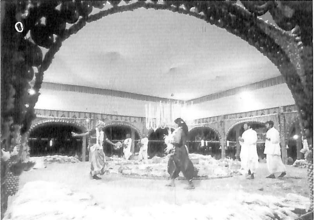
ನಾಗಮಂಡಲ ವೇದಿಕೆಯಲ್ಲಿ ನಾಗಪಾತ್ರಿ ಮತ್ತು ವೈದ್ಯರ ಬಳಗ