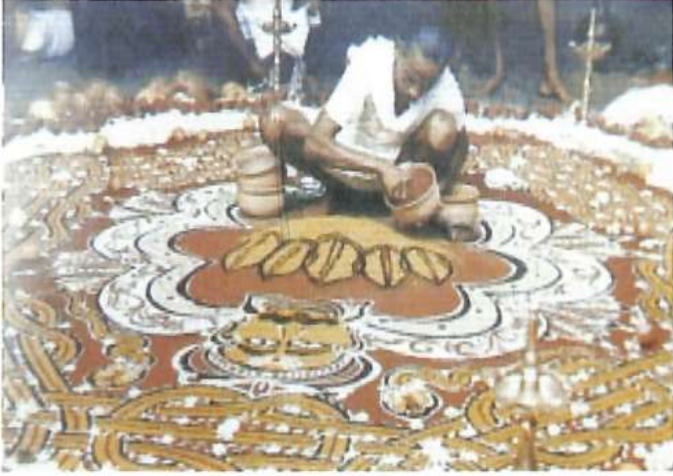
ನಾಗಮಂಡಲದ ಚಿತ್ತಾರ ರಚನೆ