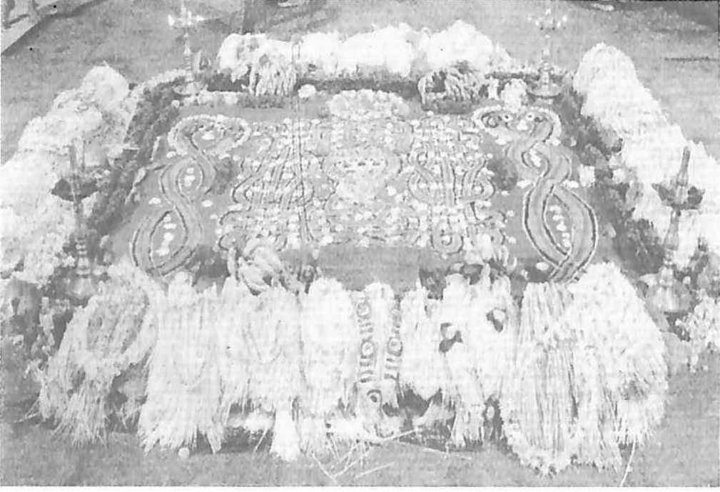
ನಾಗಮಂಡಲ ಚಿತ್ರದ ಅಲಂಕರಣ