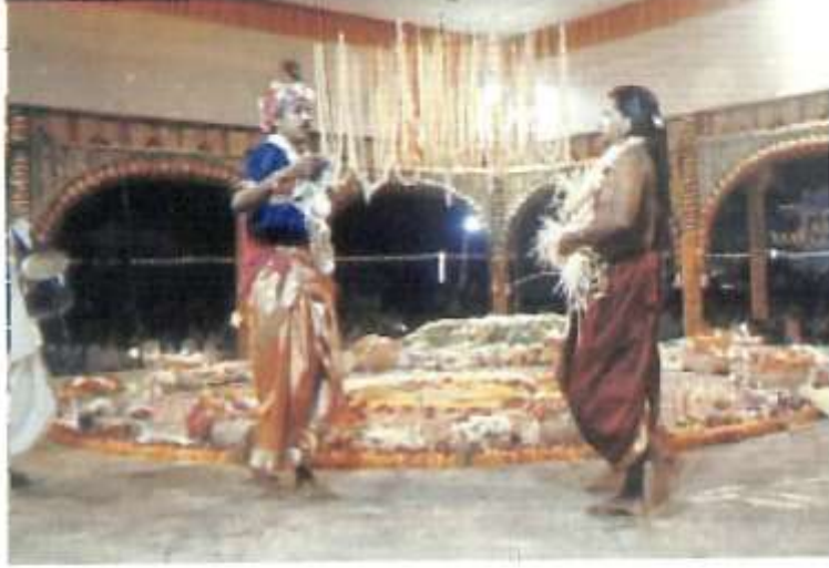
ನಾಗಮಂಡಲದ ಕುಣಿತದ ದೃಶ್ಯ