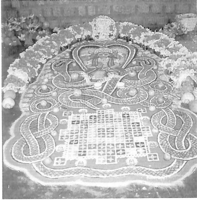
ಆಶ್ಲೇಷಾ ಬಲಿ ಚಿತ್ರಣ