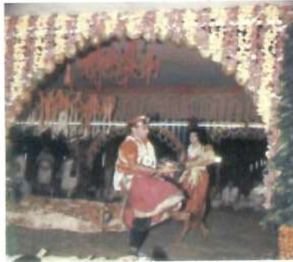
ನಾಗಪಾತ್ರಿ ಮತ್ತು ಅರ್ಧನಾರಿ ಕುಣಿತ