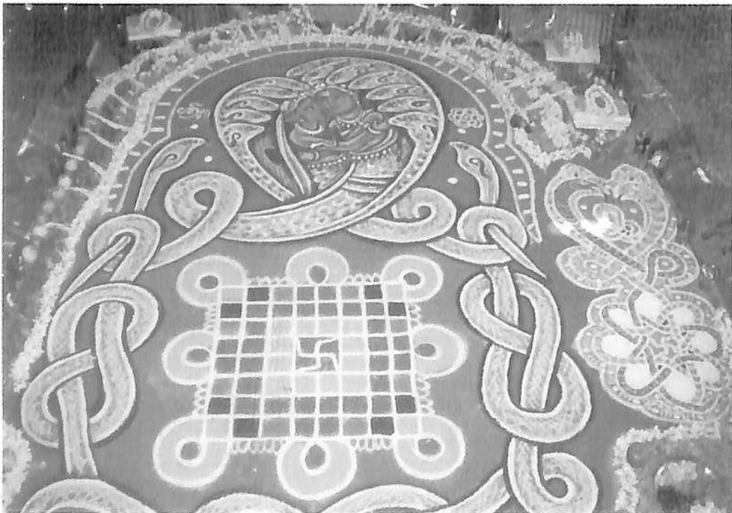
ನವೀನ ರೀತಿಯ ಆಶ್ಲೇಷಾ ಬಲಿ ಮಂಡಲ