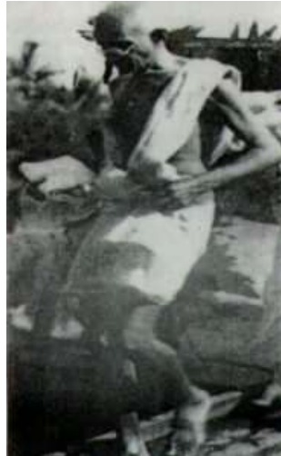
ಉದ್ಯಾವರದಲ್ಲಿ ದೋಣಿಯಿಂದ ಇಳಿಯುತ್ತಿರುವ ಗಾಂಧೀಜಿ