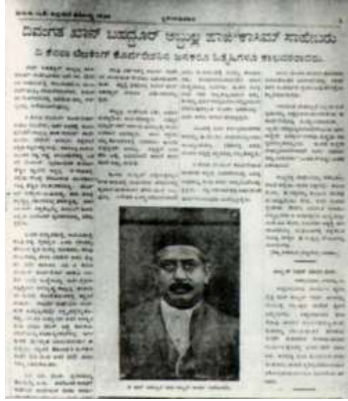
ಸ್ವದೇಶಾಭಿಮಾನಿ ಪತ್ರಿಕೆಯಲ್ಲಿ ಶ್ರದ್ಧಾಂಜಲಿ (೧೯೩೫)