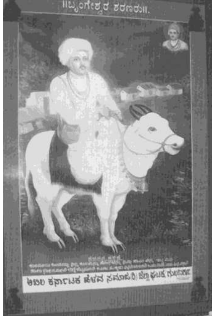
ಹೆಳವರ ಕಲ್ಪನೆಯ ಬೃಂಗೇಶ್ವರ ಶರಣರು