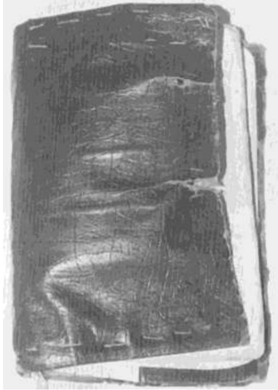
ಎತ್ತಿನ ಹೆಳವರ ಚಿಪ್ಪೋಡು