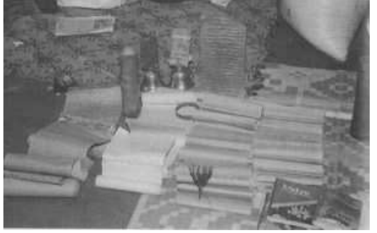
ಜಡೆಕುಂಟೆ ಗಂಟೆ ಹೆಳವರ ತಾಮ್ರ ಪಟಗಳು, ವಂಶಾವಳಿ ದಾಖಲೆಗಳು