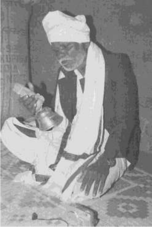
ಗಂಟೆ ಹೆಳವ ಸಮುದಾಯದ ಗಾಯಕ,