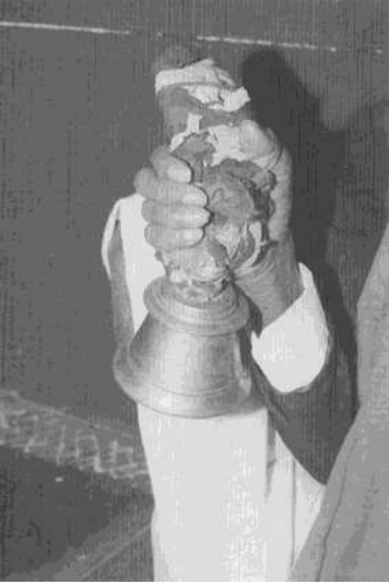
ಗಂಟೆ ಹೆಳವರು ಬಳಸುವ ಗಂಟೆ, ಜಡೆಕುಂಟೆ