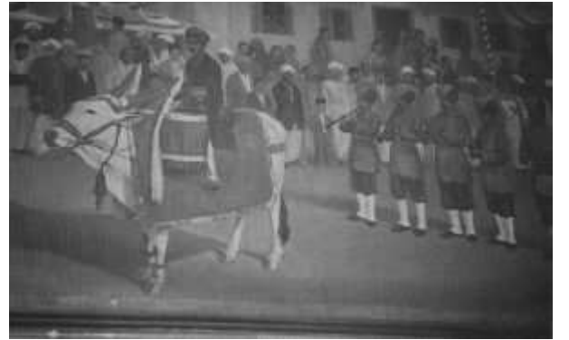
ಬುರುಡಿಕುಂಟೆ ಮೈಸೂರು ಅರಮನೆಯಲ್ಲಿನ ಎತ್ತಿನ ಹೆಳವರ ಕಲಾಕೃತಿ