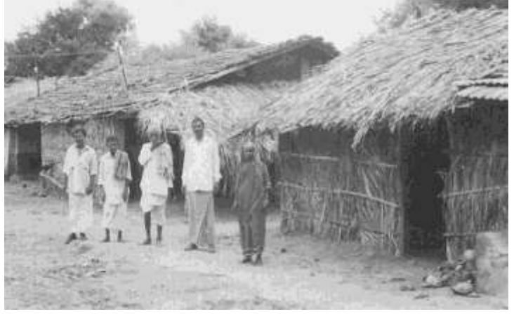
ಗಂಟೆ ಹೆಳವರ ಮನೆಗಳೂ, ಕಡೂರು, ಚಿಕ್ಕಮಗಳೂರು ಜಿಲ್ಲೆ