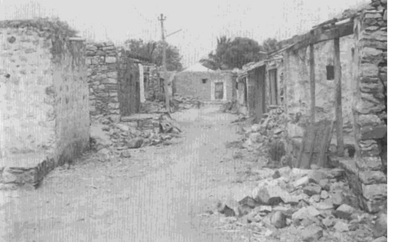
ಅಲೆಮಾರಿ ಎತ್ತಿನ ಹೆಳವರ ನಿರ್ಜನ ಓಣಿ, ಬೆಂಚಿನಮರಡಿ ಗ್ರಾಮ, ಬೆಳಗಾಂ ಜಿಲ್ಲೆ