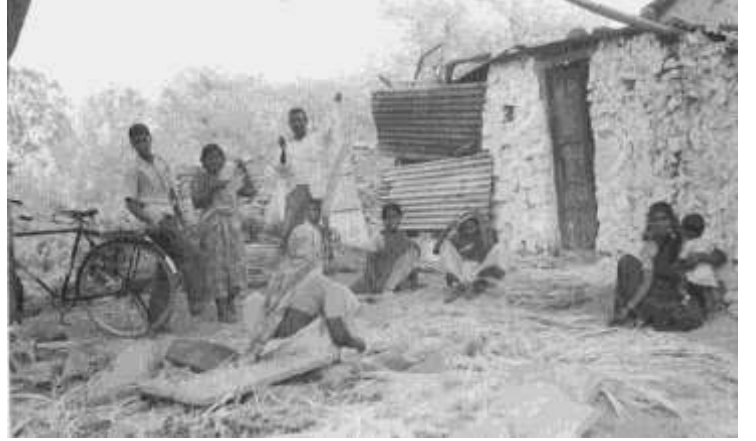
ಚಾಪೆ ಹೆಳವರು, ಕಟಗಲ್, ಗುಲ್ಬರ್ಗಾ ಜಿಲ್ಲೆ