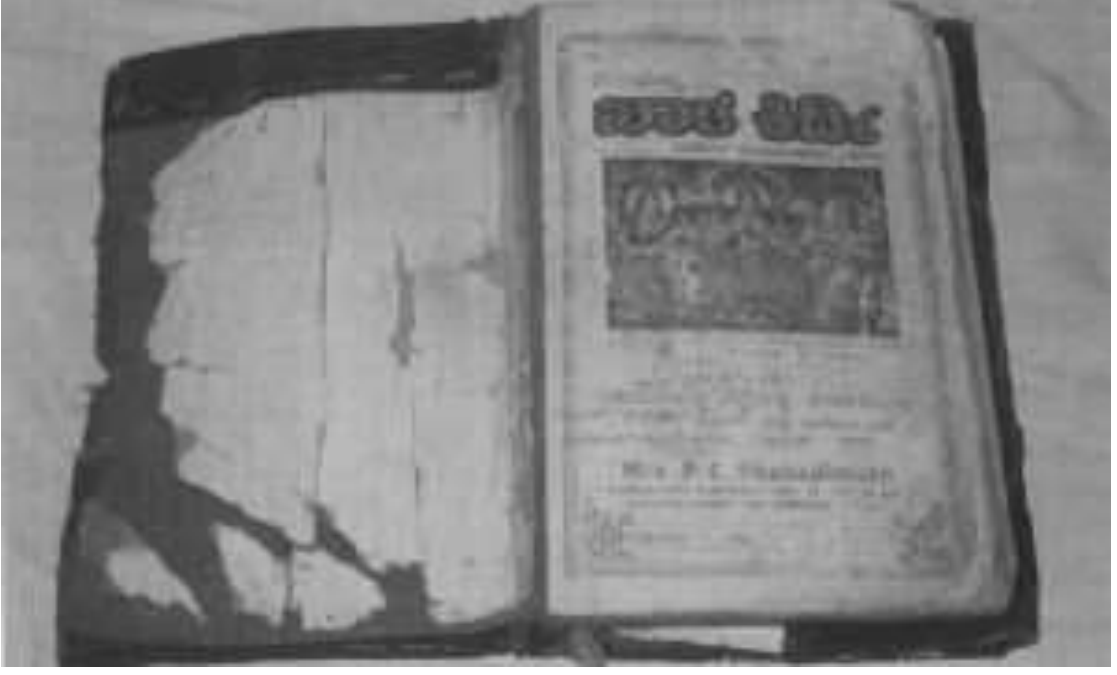
ಎತ್ತಿನ ಹೆಳವರ ಚಿಪ್ಪೋಡು ಜೋಕಾನಹಟ್ಟಿ