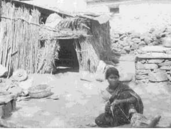
ಚಾಪೆ ಹೆಳವರು, ಕಟಗಲ್, ಗುಲ್ಬರ್ಗಾ ಜಿಲ್ಲೆ