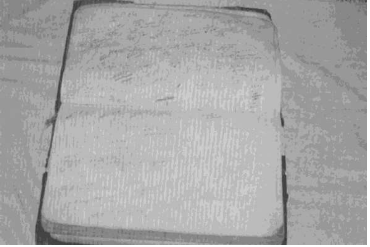
ತೆರೆದ ಚಿಪ್ಪೋಡಿನಲ್ಲಿಯ ವಂಶಾವಳಿ ವಿವರ, ಎತ್ತಿನ ಹೆಳವ