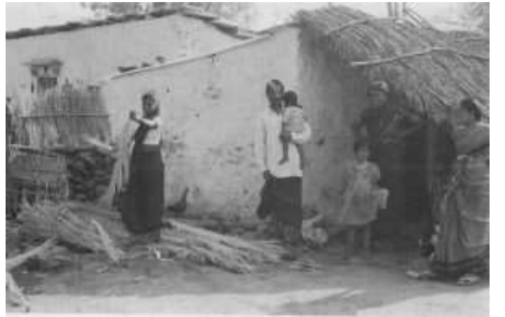
ಚಾಪೆ ಹೆಳವರು, ಘಾಟ್‌ಬೋರಾಳ್, ಬೀದರ್ ಜಿಲ್ಲೆ