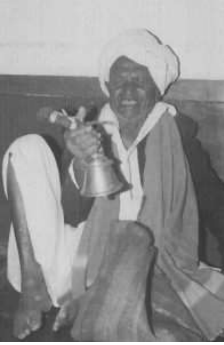
ಗಂಟೆ ಹೆಳವ ಸಮುದಾಯ ವ್ಯಕ್ತಿ,