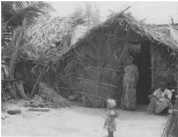
ಗಂಟೆ ಹೆಳವರ ಗುಡಿಸಲು, ಗೋಪನಾಳ, ಚಿತ್ರದುರ್ಗ ಜಿಲ್ಲೆ