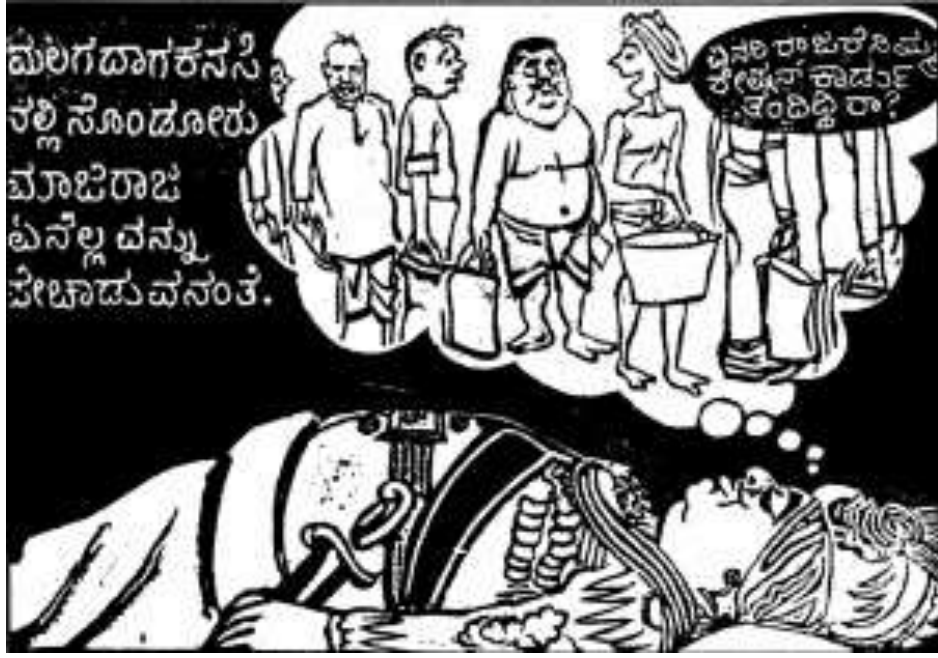
ಸೊಂಡೂರು ರಾಜರು ಅಧಿಕಾರ ಕಳೆದುಕೊಂಡಾಗಿನ ಜನಾಭಿಪ್ರಾಯದ ವ್ಯಂಗ್ಯಚಿತ್ರ