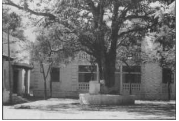
ಹೋರಾಟ ನಡೆದ ಹಳೆಯ ತಾಲೂಕು ಕಚೇರಿ