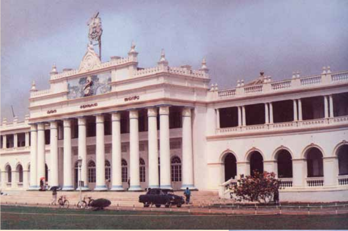
ಕ್ರಾಫರ್ಡ್ ಸಭಾಂಗಣ ,ಮೈಸೂರು ವಿಶ್ವವಿದ್ಯಾಲಯ ಮೈಸೂರು