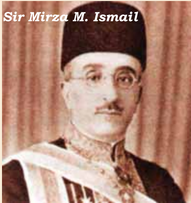
Sir Mirza M. Ismail

ಕ್ರಿ.ಶ.೧೮೭೦ರಲ್ಲಿ ಜಿಲ್ಲಾ ಬೊಕ್ಕಸಗಳಿಗೆ ಅಂಟಿಕೊಂಡಂತೆ ಜಿಲ್ಲಾ ಉಳಿತಾಯ ಬ್ಯಾಂಕ್‌ಗಳನ್ನು ಪ್ರಾರಂಭ ಮಾಡಲಾಯಿತು. ಕ್ರಿ.ಶ.೧೮೬೮ರಲ್ಲಿ, ಬೆಂಗಳೂರಿನಲ್ಲಿ ಮೂರು ಬ್ಯಾಂಕಿಂಗ್ ಕಂಪನಿಗಳನ್ನು ಪ್ರಾರಂಭಿಸಲಾಯಿತು, ಅಂತಹ ೨೪ ಸಂಸ್ಥೆಗಳನ್ನು ಕ್ರಿ.ಶ.೧೮೭೬ರ ವೇಳೆಗೆ ಸ್ಥಾಪನೆ ಮಾಡಿದ್ದರೂ, ಎಲ್ಲವೂ ಉಳಿಯಲಿಲ್ಲ. ಕ್ರಿ.ಶ.೧೮೭೦ರಲ್ಲಿ ಚಿತ್ರದುರ್ಗ ಉಳಿತಾಯ ಬ್ಯಾಂಕನ್ನು ಸ್ಥಾಪಿಸಲಾಯಿತು. ಕ್ರಿ.ಶ.೧೮೬೩ರಲ್ಲಿ, ಬಾಂಬೆ ಪ್ರೆಸಿಡೆನ್ಸಿ ಬ್ಯಾಂಕಿನ ಶಾಖೆಯನ್ನು ಧಾರವಾಡದಲ್ಲಿ ಪ್ರಾರಂಭಿಸಲಾಯಿತು, ಮದ್ರಾಸ್ ಪ್ರೆಸಿಡೆನ್ಸಿ ಬ್ಯಾಂಕು, ತನ್ನ ಬೆಂಗಳೂರು ಶಾಖೆಯನ್ನು ಕ್ರಿ.ಶ.೧೮೬೪ರಲ್ಲಿ ತೆರೆಯಿತು. ತದನಂತರ, ಕ್ರಿ.ಶ.೧೮೬೭ರಲ್ಲಿ ಮಂಗಳೂರಿನಲ್ಲೂ, ಕ್ರಿ.ಶ.೧೮೭೦ರಲ್ಲಿ ಹುಬ್ಬಳ್ಳಿಯಲ್ಲೂ ಹಾಗೂ ಕ್ರಿ.ಶ.೧೮೭೨ರಲ್ಲಿ ಕುಮಟಾದಲ್ಲೂ ಶಾಖೆಗಳನ್ನು ತೆರೆಯಲಾಯಿತು. ದಕ್ಷಿಣ ಕೆನರಾಗೆ ತನ್ನದೆ ಆದ ಬ್ಯಾಂಕಿಂಗ್ ಸಂಸ್ಥೆಗಳಾದ ೧೯೦೬ರಲ್ಲಿ ಮಂಗಳೂರಿನಲ್ಲಿ ಪ್ರಾರಂಭವಾದ ಕೆನರಾ ಬ್ಯಾಂಕ್ ಹಾಗೂ ೧೯೦೬ರಲ್ಲಿ ಉಡುಪಿಯಲ್ಲಿ ಪ್ರಾರಂಭವಾದ ಕಾರ್ಪೊರೇಷನ್ ಬ್ಯಾಂಕ್‌ಗಳಿದ್ದವು. ನಂತರ, ೧೯೨೦ರಲ್ಲಿ ಪಾಂಗಾಳ ನಾಯಕ್ ಬ್ಯಾಂಕ್, ೧೯೨೩ರಲ್ಲಿ ಜಯಲಕ್ಷ್ಮಿ ಬ್ಯಾಂಕ್, ೧೯೨೪ರಲ್ಲಿ ಕರ್ನಾಟಕ ಬ್ಯಾಂಕ್, ಉಡುಪಿ ಬ್ಯಾಂಕ್, ೧೯೨೫ರಲ್ಲಿ ಕ್ಯಾಥೋಲಿಕ್ ಬ್ಯಾಂಕ್, ವಿಜಯಾ ಬ್ಯಾಂಕ್ ಹಾಗೂ ಸಿಂಡಿಕೇಟ್ ಬ್ಯಾಂಕ್‌ಗಳನ್ನು ಸ್ಥಾಪನೆ ಮಾಡಲಾಯಿತು. ೧೯೧೫ರಲ್ಲಿ ಪಟ್ಟಣ ಸಹಕಾರಿ ಬ್ಯಾಂಕ್‌ನ್ನು ಹೊಸಪೇಟೆಯಲ್ಲಿ ಪ್ರಾರಂಭ ಮಾಡಲಾಯಿತು. ೧೯೦೬ರಲ್ಲಿ ಪ್ರಾರಂಭವಾದ ಕಣಗಿನಹಾಳಗದಗತಾದ ಸಹಕಾರಿ ಸಂಘದಿಂದ ಪ್ರಾರಂಭವಾಗಿ, ಧಾರವಾಡ ಜಿಲ್ಲೆಯಲ್ಲಿ ಹಲವಾರು ಸಹಕಾರಿ ಸಂಘಗಳನ್ನು ಪ್ರಾರಂಭಿಸಲಾಯಿತು. ಅವುಗಳಲ್ಲಿ ಅನೇಕವು ಈಗಿನ ಗದಗ ಜಿಲ್ಲೆಯಲ್ಲಿವೆ.