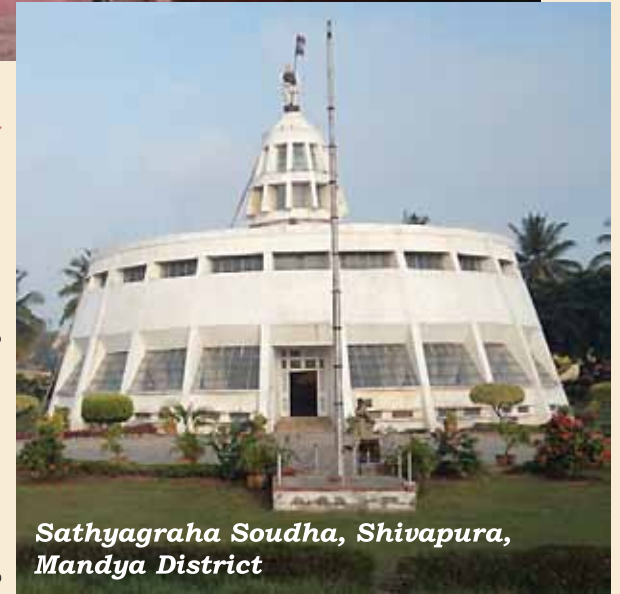
Sathyagraha Soudha, Shivapura, Mandya District

೧೯೩೭ರವರೆಗೆ ಮೈಸೂರು ರಾಜ್ಯದಲ್ಲಿ ಯಾವುದೇ ಪ್ರತಿಭಟನೆಗಳು ಇಲ್ಲದಿದ್ದರೂ, ಆ ವರ್ಷದಲ್ಲಿ ಮೈಸೂರು ರಾಜ್ಯದ ಜನರು ಮೈಸೂರು ಕಾಂಗ್ರೆಸ್‌ನ ಸ್ಥಾಪನೆ ಮಾಡಿ ಶಿವಪುರದಲ್ಲಿ (ಮಂಡ್ಯ ಜಿಲ್ಲೆ) ಮೈಸೂರು ಕಾಂಗ್ರೆಸ್‌ನ ಪ್ರಥಮ ಅಧಿವೇಶನವನ್ನು ಏಪ್ರಿಲ್ ೧೯೩೮ರಲ್ಲಿ ಆಯೋಜಿಸುವುದರೊಂದಿಗೆ ಮೂಲಕ ಧ್ವಜಸತ್ಯಾಗ್ರಹವನ್ನು ಪ್ರಾರಂಭಿಸಲಾಯಿತು. ಇದಾದ ಸ್ವಲ್ಪವೇ ಅವಧಿಯ ನಂತರ ಏಪ್ರಿಲ್ ೨೫, ೧೯೩೮ರಲ್ಲಿ, ವಿದುರಾಶ್ವತ್ಥ (ಕೋಲಾರ ಜಿಲ್ಲೆ) ಅನಾಹುತವು ಜರುಗಿ, ಅದರಲ್ಲಿ ಪೊಲೀಸ್ ಗುಂಡಿನೇಟಿನಿಂದ ೧೦ ಸತ್ಯಾಗ್ರಹಿಗಳು ಮರಣ ಹೊಂದಿದರು. ಇದಾದ ನಂತರ, ೧೯೩೯ರಲ್ಲಿ ಅರಣ್ಯ ಸತ್ಯಾಗ್ರಹವು ಪ್ರಾರಂಭವಾಯಿತು, ಈ ಮೂಲಕ ರಾಜಾಡಳಿತ