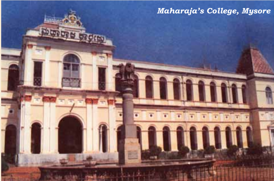
Maharaja's College, Mysore

ಮಹಾರಾಜರಾದ ಮುಮ್ಮಡಿ ಕೃಷ್ಣರಾಜ ಒಡೆಯರ್ ಸಣ್ಣವರಿದ್ದಾಗ, ಅಂದರೆ, ಕ್ರಿ.ಶ. ೧೮೧೦ರವರೆಗೂ, ಪೂರ್ಣಯೃವರನ್ನು ಮುಖ್ಯ ಆಡಳಿತಗಾರರಾಗಿ (ದಿವಾನ್) ನೇಮಕ ಮಾಡಲಾಗಿತ್ತು; ನಂತರ ಕೃಷ್ಣರಾಜರು ಆಡಳಿತದ ಭಾರವನ್ನು ವಹಿಸಿಕೊಂಡರು. ಕ್ರಿ.ಶ. ೧೮೩೦ರಲ್ಲಿ, ಹಿಂದೆ ಕೆಳದಿಯ ನಾಯಕರ ಅಡಿಯಲ್ಲಿ ರಾಜ್ಯದಲ್ಲಿದ್ದ ಹೈದರ್ ಆಲಿಯಿಂದ ಸ್ವಾಧೀನಪಡಿಸಿಕೊಳ್ಳಲಾಗಿದ್ದ ನಗರ