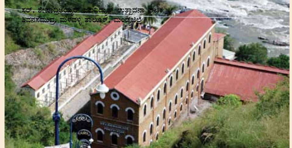
ಸರ್, ಶೇಷಾದ್ರಿ ಅಯ್ಯರ ಜಲವಿದ್ಯುತ್ ಉತ್ಪಾದನಾ ಸಚಿವ ಶಿವನಸಮುದ್ರ, ಮಳವಳ್ಳಿ ತಾಲೂಕ್, ಮಂಡ್ಯ ಜಿಲ್ಲೆ

ಕ್ರಿ.ಶ.೧೮೮೬ರಲ್ಲಿ, ಶೇಷಾದ್ರಿ ಅಯ್ಯರವರು ಕೋಲಾರ ಪ್ರದೇಶದಲ್ಲಿ (ಕೋಲಾರ್ ಗೋಲ್ಡ್