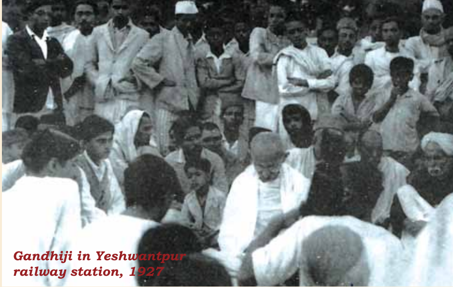
Gandhiji in Yeshwantpur railway station, 1927

ಕೊಟ್ಟೂರು, ಕೂಡ್ಲಿಗಿ, ಕಣವಿನಹಳ್ಳಿ, ಸಂಡೂರು, ಬಳ್ಳಾರಿ, ಹೊಸಪೇಟೆ, ಭಾನಾಪುರ, ಗದಗ, ಜಕ್ಕಳಿ, ಹುಬ್ಬಳ್ಳಿ, ಧಾರವಾಡ, ಮರೇವಾಡ, ಅಮ್ಮಿನಭಾವಿ, ಮೊರಬ, ಹಾರೋಬೀಡಿ, ಇನಾಮ್ ಹೊಂಗಲ, ಉಪ್ಪಿನ ಬೆಟಗೆರಿ, ಹಿರೇಹುಲ್ಲಕೆರೆ, ಸೌಂದತ್ತಿ, ಗುರ್ಲಹೊಸೂರು, ಬೈಲಹೊಂಗಲ, ಸಂಪಗಾಂವ್, ಬಾಗೇವಾಡಿ, ಬೆಳಗಾವಿ, ತೊಂಡಕಟ್ಟೆ, ಯಮಕನಮರಡಿ, ವಂಟಮುರಿ, ಹುಕ್ಕೇರಿ, ಗೋಕಾಕ್, ಸಂಕೇಶ್ವರ, ಗಡೀಹಿಂಗಳಗ, ಹಟ್ಟಿಕಣಗಳೆ; ಮಹಾರಾಷ್ಟ್ರದಲ್ಲಿ; ನಿಪ್ಪಾಣಿ, ಭೋಜ್, ಹಾವಿನಹಾಳ, ಕೊಟಹಳ್ಳಿ, ಧೋಲಗರವಾಡಿ, ಚಿಕ್ಕೋಡಿ, ಅಂಕಲಿ, ಸೇಡ್ಬಾಲ್, ಮಂಗಸೂಳಿ, ಬನಹಟ್ಟಿ, ಅಥಣಿ, ಹೊನ್ನವಾಡ, ತಿಕ್ಕೋಟಾ, ತೊರವಿ, ಬಿಜಾಪುರ ಹಾಗೂ ಇಳ್ಳಲ್ಗಳಿಗೆ ಭೇಟಿ ನೀಡಿ, ಹೈದರಾಬಾದ್‌ಗೆ ತೆರಳಿದರು. ಎರಡು ತಿಂಗಳಿಗೂ ಹೆಚ್ಚಿನ ಅವಧಿಯ ಈ ಪ್ರವಾಸವು ಗಾಂಧೀಜಿಯವರು ಹರಿಜನರೆಂದು ಉದ್ದೇಶಿಸುತ್ತಿದ್ದವರಲ್ಲಿ ಸಾಮಾಜಿಕ ಅರಿವನ್ನು ಮೂಡಿಸಿ, ಆತ್ಮವಿಶ್ವಾಸ ಹಾಗೂ ಧೈರ್ಯವನ್ನು ಹೆಚ್ಚಿಸಿತು.