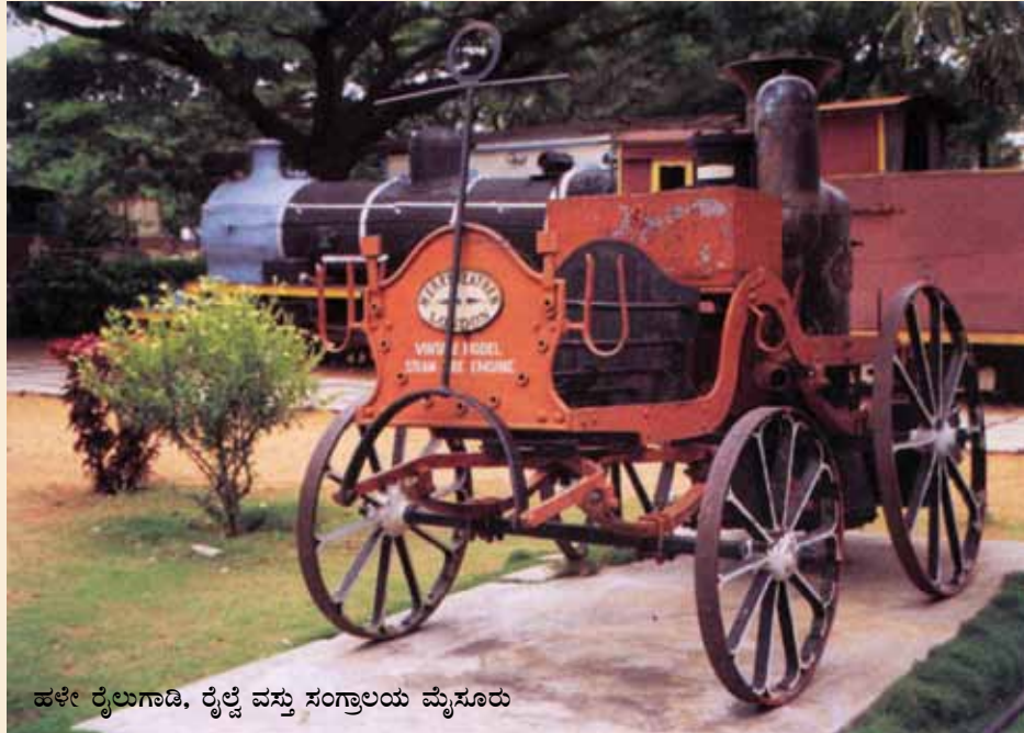
ಹಳೇ ರೈಲುಗಾಡಿ, ರೈಲ್ವೆ ವಸ್ತು ಸಂಗ್ರಾಲಯ ಮೈಸೂರು

ನೀರಾವರಿಯ ಸುಧಾರಣೆಗಾಗಿ, ದಿವಾನ್ ಪೂರ್ಣಯ್ಯನವರು ಸಾಗರಕಟ್ಟೆಯಲ್ಲಿ ಕಾವೇರಿಗೆ ಅಡ್ಡಲಾಗಿ ಅಣೆಕಟ್ಟನ್ನು ನಿರ್ಮಾಣ ಮಾಡುವ ಆದೇಶವನ್ನು ನೀಡಿದರು. ಕಬ್ಬನ್‌ರವರ ಆಳ್ವಿಕೆಯಲ್ಲಿ, ಬೆಂಗಳೂರು ಹಾಗೂ ಚೋಲಾರ್‌ಪೇಟೆಗಳ ನಡುವೆ ಪ್ರಪ್ರಥಮ ಬ್ರಾಡ್ ಗೇಜ್ ರೈಲು ಹಳಿಯನ್ನು ಸ್ಥಾಪನೆ ಮಾಡಲಾಯಿತು, ಆದರೆ ಬೌರಿಂಗ್‌ರವರು ಕಮೀಷನರ್ ಆದಾಗ, ಅದರ ಉದ್ಘಾಟನೆಯನ್ನು ಕ್ರಿ.ಶ.೧೮೬೪ರಲ್ಲಿ ಮಾಡಲಾಯಿತು. ಸುಮಾರು ೨,೫೬೦ ಕಿ.ಮೀ. ಉದ್ದದ ರಸ್ತೆಗಳು ಹಾಗೂ ೩೦೦ ಸೇತುವೆಗಳ ನಿರ್ಮಾಣಕ್ಕೆ ಕಬ್ಬನ್ ಕಾರಣವಾದರು. ಕ್ರಿ.ಶ.೧೮೮೨ರಲ್ಲಿ, ಬೆಂಗಳೂರು-ಮೈಸೂರು ಮೀಟರ್ ಗೇಜ್ ರೈಲು ಹಳಿಯನ್ನು ಪೂರ್ಣಗೊಳಿಸುವ ಕಾರ್ಯವನ್ನು ರಂಗಾಚಾರ್ಯ ಮಾಡಿದರು. ರೂ.೫೫.೪೮ ಲಕ್ಷಗಳ ಬಜೆಟ್‌ನೊಂದಿಗೆ, ಕ್ರಿ.ಶ.೧೮೭೭ರಲ್ಲಿ ಕಮೀಷನರ್ ಆಳ್ವಿಕೆಯಲ್ಲಿ ಈ ಕಾಮಗಾರಿಯನ್ನು ಪ್ರಾರಂಭಿಸಲಾಗಿತ್ತು. ಕಾಫೀ ನೆಡುತೋಪುಗಳಿಗಾಗಿ ೧೫೦ ಲಕ್ಷ ಎಕರೆಗೂ ಹೆಚ್ಚು ಭೂಮಿಯನ್ನು ನಿಯುಕ್ತಗೊಳಿಸಲಾಯಿತು. ಅವರು ಸಾರ್ವಜನಿಕ ಕಾಮಗಾರಿ ಹಾಗೂ ಅರಣ್ಯ ಇಲಾಖೆಗಳ ಸ್ಥಾಪನೆಯನ್ನು ಮಾಡಿದರು. ಕ್ರಿ.ಶ.೧೮೭೦ರಲ್ಲಿ, ಜಿಲ್ಲಾ ಉಳಿತಾಯ ಬ್ಯಾಂಕ್‌ನ್ನು ಮೈಸೂರಿನಲ್ಲಿ ಪ್ರಾರಂಭ ಮಾಡಿದರು.