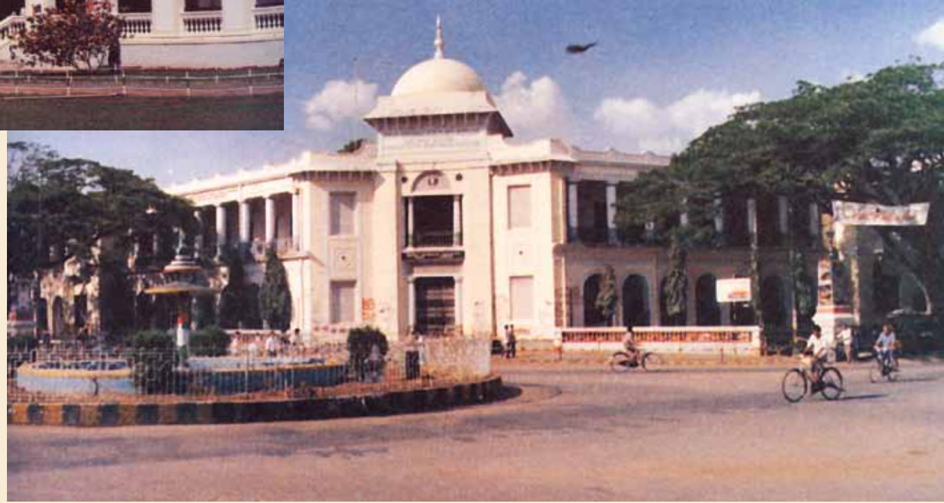
ಭಾರತೀಯ ವೈದ್ಯಕೀಯ ಸರ್ಕಾರಿ ಕಾಲೇಜು, ಮೈಸೂರು