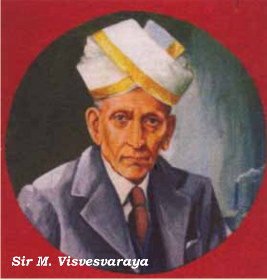
Sir M. Visvesvaraya