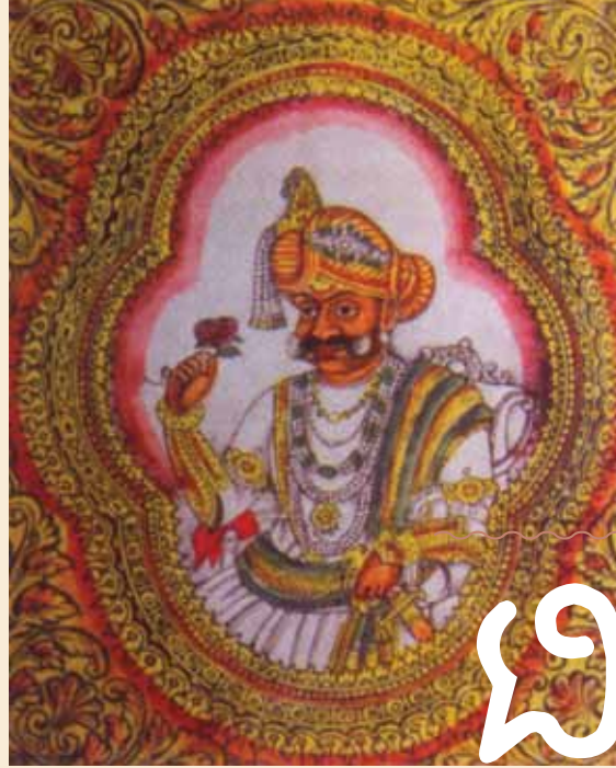
ಮುಮ್ಮಡಿ ಕೃಷ್ಣರಾಜ ಒಡೆಯರ್