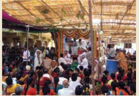
ಜಾತ್ರೆಯ ಒಂದು ದೃಶ್ಯ

ರಾಮನವಮಿ ಮತ್ತು ಗಣೇಶ ಚತುರ್ಥಿ ಸಂದರ್ಭಗಳಲ್ಲಿ ಅತ್ಯುತ್ತಮದಿಂದ ನಾಗರಿಕರು ಪೂಜೆ ಮೆರವಣಿಗೆಗಳಲ್ಲಿ ಪಾಲ್ಗೊಳ್ಳುವರು. ಉತ್ಸವ ಕಾಲದಲ್ಲಿ ಕೆಲವೊಮ್ಮೆ ಜನನಾಯಕರಿಂದ ಭಾಷಣ ಕಾರ್ಯಕ್ರಮಗಳು ಜರುಗಿದರೆ, ಹರಿಕಥೆ, ಸಂಗೀತ, ನೃತ್ಯ ಮತ್ತು ನಾಟಕ ಮುಂತಾದ ಕಾರ್ಯಕ್ರಮಗಳು ವಿಶೇಷ ರೀತಿಯಲ್ಲಿ ಸಾರ್ವಜನಿಕರನ್ನು ರಂಜಿಸುತ್ತವೆ. ಕೊಡವರು ಕೊಯ್ಲು ಮುಹೂರ್ತ, ಕಾವೇರಿ ಸಂಕ್ರಮಣ ಮತ್ತು ಹುತ್ತರಿ ಹಬ್ಬ (ಸುಗ್ಗಿ ಹಬ್ಬ) ಎಂಬ ಮೂರು ಮುಖ್ಯವಾದ ಹಬ್ಬಗಳನ್ನು ಸಾರ್ವಜನಿಕವಾಗಿ ಆಚರಿಸಿ ಸಂಭ್ರಮಿಸುತ್ತಾರೆ. ಇಷ್ಟೇ ಅಲ್ಲದೆ, ಬೆಂಗಳೂರು, ಮೈಸೂರು, ರಾಮನಗರ, ಮಾಲೂರು ಮುಂತಾದೆಡೆಗಳಲ್ಲಿ ಜರುಗುವ 'ಕರಗ' ಒಂದು ಸಡಗರ ಸಂಭ್ರಮದ ಧಾರ್ಮಿಕ ಆಚರಣೆಯಾಗಿದೆ. ಮುಸ್ಲಿಮರ ಪ್ರಮುಖ ಹಬ್ಬಗಳೆಂದರೆ ಈದ್-ಉಲ್-ಫಿತ್ರ್. ಇದು ರಮಜಾನ್ ಹಬ್ಬದ ಕೊನೇ ದಿನ ಉಪವಾಸ ವ್ರತದ ಅಂತ್ಯವನ್ನು ಆಚರಿಸುವ ಪವಿತ್ರ ದಿನವಾಗಿರುತ್ತದೆ. ಇದುಲ್-ಉಲ್-ಜುಹಾ ಅಥವಾ ಬಕ್ರೀದ್ ಹಬ್ಬವನ್ನು ಝಲ್-ಹಜಾ ತಿಂಗಳ ೯ನೇ ದಿನ ಆಚರಿಸುವರು. ಶಬಾನ್ ತಿಂಗಳ ೧೩ನೇ ದಿನ ಆಚರಿಸುವ ಷಬ್-ಎ-ಬರಾತ್ ಮುಸ್ಲಿಮರ ಮತ್ತೊಂದು ಮುಖ್ಯವಾದ ಹಬ್ಬ.