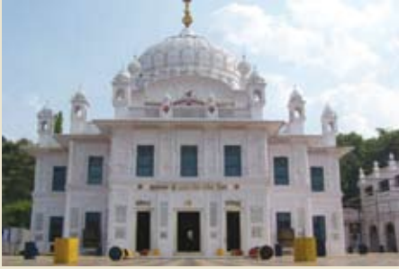
ಗುರು ನಾನಕ್ ಝರಾ, ಬೀದರ್

ಸಿಖ್ ಧರ್ಮ: ಸಿಖ್ ಧರ್ಮವೂ ಕರ್ನಾಟಕದ ಮೇಲೆ ತನ್ನದೇ ಆದ ಪ್ರಭಾವವನ್ನು ಬೀರಿದೆ. ಕರ್ನಾಟಕದ ಬೀದರ್ ಪಟ್ಟಣಕ್ಕೆ ಸಿಖ್ ಧರ್ಮಗುರು ನಾನಕರು ಭೇಟಿ ನೀಡಿದ್ದರು. ಅವರ ಪವಿತ್ರ ನೆನಪಿಗೆ