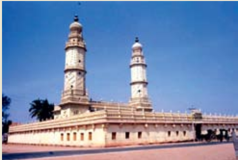
ಜಮ್‌ಯಾ ಮಸೀದಿ (ಮಸ್ಜಿದ್-ಎ-ಅಲ್ಲಾ), ಶ್ರೀರಂಗಪಟ್ಟಣ

ಇಸ್ಲಾಂ: ಇಸ್ಲಾಂ ಧರ್ಮವು ಬಹಳ ಹಿಂದೆಯೇ ಕರ್ನಾಟಕವನ್ನು ಪ್ರವೇಶಿಸಿದೆ. ಮೊದಮೊದಲು ಅರಬ್ ವ್ಯಾಪಾರಿಗಳು ಕರ್ನಾಟಕದ ಬಂದರು ಪಟ್ಟಣಗಳಿಗೆ ಬಂದು ನೆಲೆ ನಿಂತರು. ಶಾಸನಗಳು ಅವರನ್ನು ತಜ್ಜಿಕರೆಂದು ಸಂಬೋಧಿಸಿವೆ. ರಾಷ್ಟ್ರಕೂಟರ ಕಾಲದ ಖ್ಯಾತ ಸಂಜಾಂ ತಾಮ್ರಶಾಸನ ತಿಳಿಸುವಂತೆ, ಇಲ್ಲಿ ಓರ್ವ ತಜ್ಜಿಕ ರಾಜ್ಯಪಾಲನಿದ್ದನಲ್ಲದೇ ರಾಷ್ಟ್ರಕೂಟ ಸಾಮ್ರಾಜ್ಯದ ವ್ಯಾಪಾರ-ವಾಣಿಜ್ಯ ಕೇಂದ್ರಗಳಲ್ಲಿ ಮುಸ್ಲಿಮರ ಜನವಸತಿಗಳಿದ್ದವು. ಗೋವೆಯ ಕದಂಬರು ದಕ್ಷಿಣ ಕನ್ನಡದ ಆಳುಪರು ಮತ್ತು ವಿಜಯನಗರ ಕಾಲದ ಶಾಸನಗಳಲ್ಲಿ ಮುಸ್ಲಿಂ ವ್ಯಾಪಾರಿಗಳು ಏರ್ಪಡಿಸಿಕೊಂಡಿದ್ದ ಹಂಜಮಾನ (ಅಂಜುಮಾನ್) ಎಂಬ ವ್ಯಾಪಾರಿ ಸಂಘಟನೆಯ ಉಲ್ಲೇಖಗಳಿವೆ. ಅರಬ್ಬರಂತೆ ಶಫಿ ಪಂಥದವರಾಗಿರುವ ನವಾಯತರು ಮತ್ತು ಮಾಪಿಳ್ಳೆ (ಮೋಪ್ಲಾ) ಗಳು ಕರ್ನಾಟಕದ ಕರಾವಳಿ ಪ್ರದೇಶದ