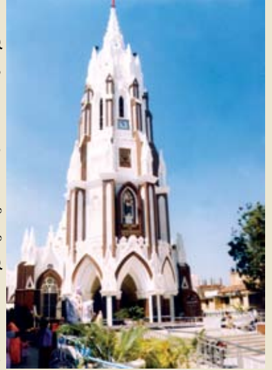
ಸೇಂಟ್ ಮೇರಿ ಬ್ಯಾಸಿಲಿಕಾ, ಬೆಂಗಳೂರು

ಕ್ರೈಸ್ತಧರ್ಮ: ಪೋರ್ಚುಗೀಸರ ಆಗಮನದೊಂದಿಗೆ ಕ್ಯಾಥೋಲಿಕ್ ಕ್ರಿಶ್ಚಿಯನ್ ಧರ್ಮ ಪ್ರಚಾರಕರೂ ಕರ್ನಾಟಕವನ್ನು ತಲುಪಿದರು. ಮಂಗಳೂರು, ಕುಂದಾಪುರ ಮತ್ತು ಹೊನ್ನಾವರಗಳಲ್ಲಿ ತಮ್ಮ ಕಾರ್ಖಾನೆಗಳನ್ನು ತೆರೆದ ಪೋರ್ಚುಗೀಸರು ವಿಜಯನಗರ ಕಾಲದಿಂದಲೇ ಹಿಂದೂಗಳ ಮತಾಂತರಕ್ಕೂ ತೊಡಗಿದರು. ಗೋವಾದಲ್ಲಿ ಪೋರ್ಚುಗೀಸರು ನಡೆಸಿದ ಪಾಪಂಡ ವಿಚಾರಣೆ, ಸಾಂಕ್ರಾಮಿಕ ರೋಗಗಳ ಹರಡುವಿಕೆ ಮತ್ತು ಕ್ಷಾಮಗಳಿಂದಾಗಿ ಅನೇಕ ಕ್ರೈಸ್ತರು ಕರ್ನಾಟಕದತ್ತ ವಲಸೆ ಬಂದರು. ಕೃಷಿ ಮತ್ತು ಪಶು ಸಂಗೋಪನೆಯಲ್ಲಿ ಹೊಸ ಹೊಸ ತಂತ್ರಜ್ಞಾನ ಮತ್ತು ಆವಿಷ್ಕಾರಗಳಿಗೆ ತಮ್ಮನ್ನು ತೆರೆದುಕೊಂಡಿದ್ದ ಕ್ರಿಶ್ಚಿಯನ್ನರನ್ನು ಕೆಳದಿಯ ನಾಯಕರು ಸ್ವಾಗತಿಸಿದರು. ಮಂಗಳೂರಿನಲ್ಲಿ ಒಂದು ಚರ್ಚನ್ನು ನಿರ್ಮಿಸಿಕೊಳ್ಳಲು ಕೆಳದಿಯ ರಾಣಿ ಚನ್ನಮ್ಮ ಅನುಮತಿ ಇತ್ತುದಲ್ಲದೆ ಅದಕ್ಕಾಗಿ ಒಂದು ನಿವೇಶನವನ್ನೂ ನೀಡಿದ್ದಳು. ಹತ್ತೊಂಬತ್ತನೇ ಶತಮಾನದ ಪ್ರಾರಂಭದಲ್ಲಿ ಪ್ರಾಟೆಸ್ಟೆಂಟ್ ಧರ್ಮ ಪ್ರಚಾರಕರು, ಮುಖ್ಯವಾಗಿ ಬ್ಯಾಸೆಲ್ ಮತ್ತು ಲಂಡನ್ ಮಿಷನರಿಯವರು, ಕರ್ನಾಟಕವನ್ನು ಪ್ರವೇಶಿಸಿದರು. ಮೊದಲು, ಅಂದರೆ ೧೮೧೦ರಲ್ಲಿ ಬಳ್ಳಾರಿಯಲ್ಲಿ ಲಂಡನ್ ಮಿಷನ್ ತನ್ನ ಚಟುವಟಿಕೆಯನ್ನು ಪ್ರಾರಂಭಿಸಿ ೧೮೨೦ರ ವೇಳೆಗೆ ಅದು ಬೆಂಗಳೂರಿಗೂ ಬಂದಿತು. ಮೈಸೂರು ಸಂಸ್ಥಾನದಲ್ಲಿ ೧೮೨೧ರಿಂದ ತಮ್ಮ ಚಟುವಟಿಕೆಗಳನ್ನು ವೆಸ್ಲಿಯನ್ ಮಿಷನರಿಯವರು ಪ್ರಾರಂಭಿಸಿದರು. ಮಂಗಳೂರಿನಲ್ಲಿ ೧೮೩೪ರಿಂದ ತಮ್ಮ ಚಟುವಟಿಕೆಗಳನ್ನು ಪ್ರಾರಂಭಿಸಿದ ಬಾಸೆಲ್ ಮಿಷನರಿಯವರು ಶೀಘ್ರವಾಗಿಯೇ ಧಾರವಾಡ, ಹುಬ್ಬಳ್ಳಿ, ಹಾವೇರಿ ಮತ್ತು ಗದಗಿಗೆ ಅವುಗಳನ್ನು ವಿಸ್ತರಿಸುವಲ್ಲಿ ಯಶ ಸಾಧಿಸಿದರು. ಬಾಸೆಲ್ ಮಿಷನರಿಯವರು ೧೮೪೩ರಿಂದ 'ಮಂಗಳೂರು ಸಮಾಚಾರ' ಎಂಬ ಪ್ರಪ್ರಥಮ ಕನ್ನಡ ಸುದ್ದಿ ಪತ್ರಿಕೆಯೊಂದನ್ನು ಆರಂಭಿಸಿದರು. ನೂರಾರು ವರ್ಷಗಳಿಂದ ತಾಳೆಗರಿಗಳ ಕಟ್ಟುಗಳಲ್ಲಿಯೇ ಉಳಿದುಕೊಂಡಿದ್ದ ಕನ್ನಡದ ಅನೇಕ ಶಾಸ್ತ್ರೀಯ ಗ್ರಂಥಗಳನ್ನು ಅವರು ಮುದ್ರಣ ಮಾಡಿದರು. ಕ್ಯಾಥೋಲಿಕ್ ಮತ್ತು ಪ್ರಾಟೆಸ್ಟೆಂಟ್ ಮಿಷನರಿಗಳು ಮಂಗಳೂರು, ಮಡಿಕೇರಿ, ಬೆಂಗಳೂರು, ಬಳ್ಳಾರಿ, ಧಾರವಾಡ, ಬೆಳಗಾವಿ ಮುಂತಾದೆಡೆ ಇಂಗ್ಲೀಷ್ ಶಾಲೆಗಳನ್ನು ತೆರೆದರಲ್ಲದೆ ಆಸ್ಪತ್ರೆಗಳನ್ನು ಸ್ಥಾಪಿಸಿ ವೈದ್ಯಕೀಯ ಸೇವೆಗಳನ್ನೂ ಪರಿಚಯಿಸಿದರು.