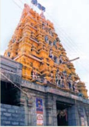
ನರಸಿಂಹ ದೇವಸ್ಥಾನ, ಗಾಣಗಾಪುರ

ನಾಥಪಂಥ: ಮಹಾಯಾನ ಬೌದ್ಧ ಪಂಥ, ಮತ್ತು ಶೈವ ಪಂಥಗಳ ಒಂದು ಸಂಯುಕ್ತ ರೂಪವಾದ ನಾಥ ಪಂಥ ಕರ್ನಾಟಕದಲ್ಲಿ ಜನಪ್ರಿಯವಾಗಿತ್ತು. ಈಗಲೂ ರಾಜ್ಯದ ಅನೇಕ ಕಡೆಗಳಲ್ಲಿ ನಾಥ ಪಂಥದ ಮಠಗಳು ಕಂಡು ಬರುತ್ತವೆ. ಬೆಳಗಾವಿ ಜಿಲ್ಲೆಯ ಹಂಡಿ ಬಡಗನಾಥ, ದಕ್ಷಿಣ ಕನ್ನಡ ಜಿಲ್ಲೆಯ ಕದ್ರಿ ಮತ್ತು