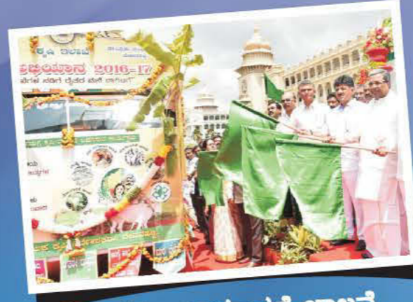
ರೈಷಿ ಅಭಿಯಾನಕ್ಕೆ ಚಾಲನೆ

ಕಂಠೀರವ ಕ್ರೀಡಾಂಗಣದಲ್ಲಿ ವಿಶ್ವ ಯೋಗ ದಿನಾಚರಣೆ