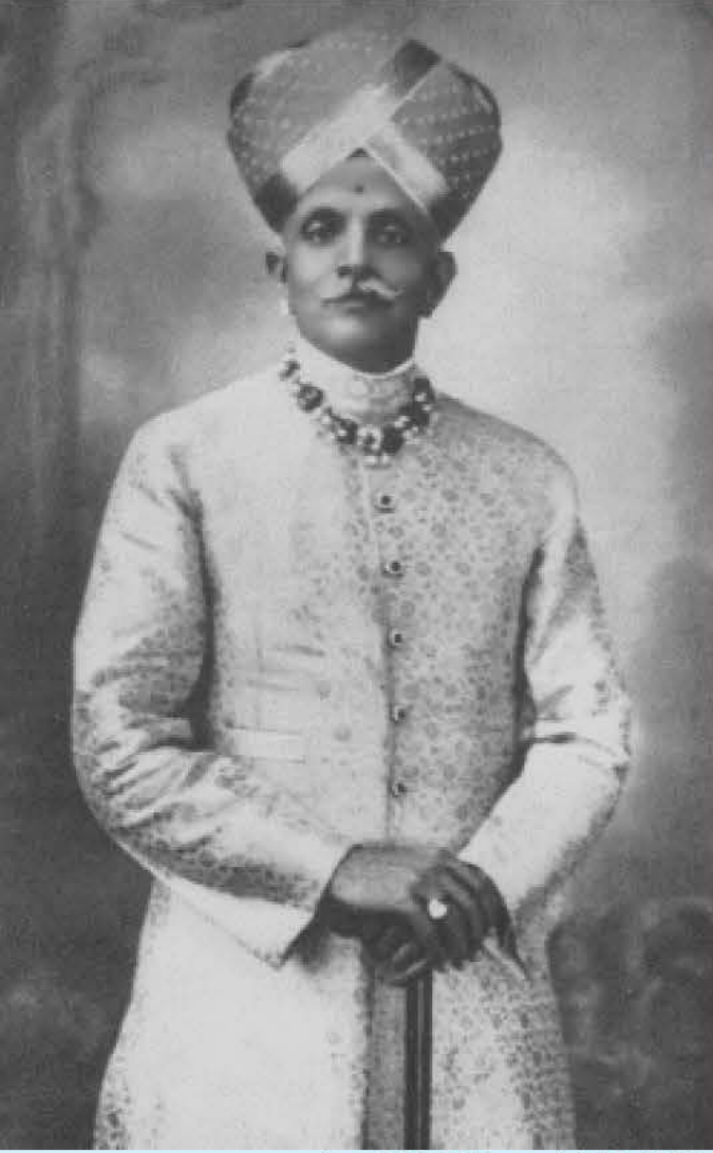
(ಜೂನ್ 04, 1884 - ಆಗಸ್ಟ್ 03, 1940)