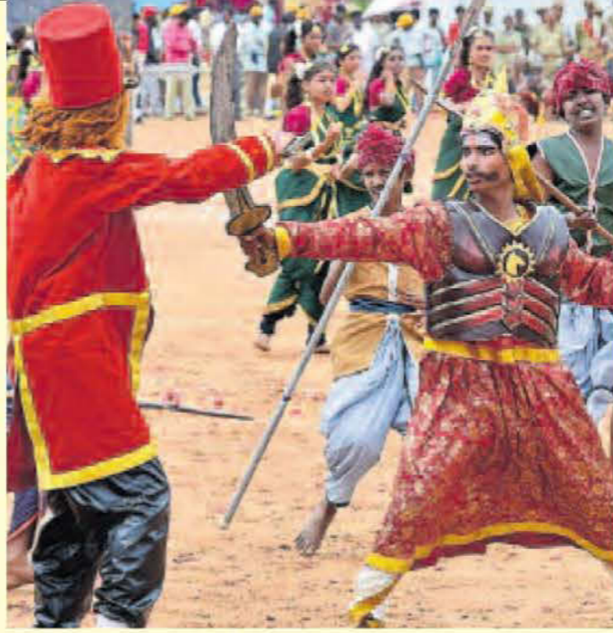
ಪ್ರಯೋಜನವನ್ನು ಪಡೆದು ಕೊಂಡಿದ್ದಾರೆ.

ವಿದೇಶದಲ್ಲಿ ಉನ್ನತ ವ್ಯಾಸಂಗ ಪಡೆಯುವ ವಿದ್ಯಾರ್ಥಿಗಳಿಗೆ ಶಿಷ್ಯವೇತನ 10 ಲಕ್ಷ ರೂ. ಗಳಿಂದ 20 ಲಕ್ಷ ರೂ. ಗಳಿಗೆ ಹೆಚ್ಚಿಸಲಾಗಿದೆ. ಈವರೆಗೆ ಸುಮಾರು 360 ವಿದ್ಯಾರ್ಥಿಗಳು ಇದರ