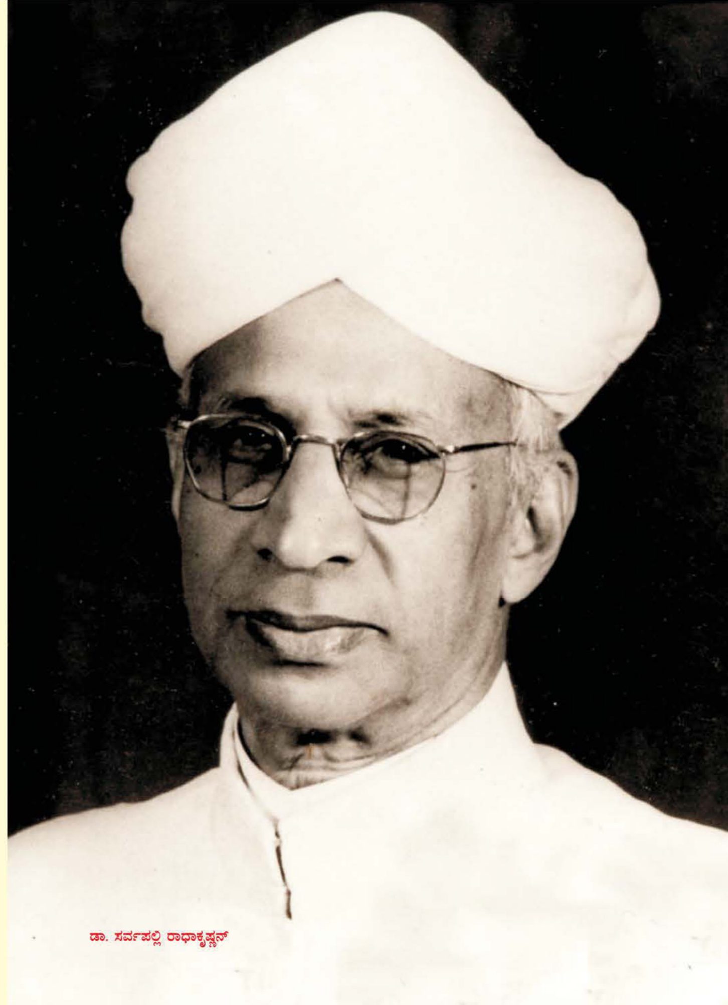
ಡಾ. ಸರ್ವಪಲ್ಲಿ ರಾಧಾಕೃಷ್ಣನ್