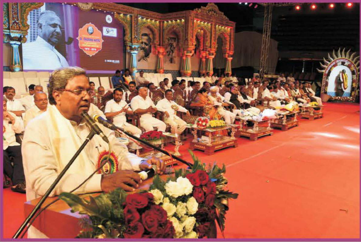
ಸಾಮಾಜಿಕ ಪರಿವರ್ತನೆಯ ಹರಿಕಾರ, ಮಾಜಿ ಮುಖ್ಯಮಂತ್ರಿ ಡಿ. ದೇವರಾಜ ಅರಸು ಅವರ 101ನೇ ಜನ್ಮದಿನಾಚರಣೆ ಹಾಗೂ ಜನ್ಮಶತಮಾನೋತ್ಸವ ಸಮಾರೋಹ ಸಮಾರಂಭ ಬೆಂಗಳೂರಿನಲ್ಲಿ ನಡೆಯಿತು.