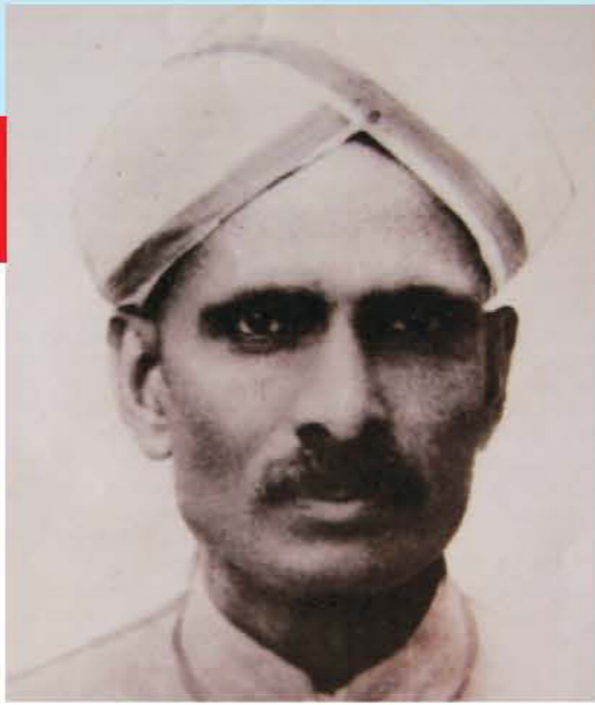
ಉಡುತ್ತಿದ್ದು ಮೇಲುಕೋಟೆ ಅಂಚಿನ ಪಂಚೆ.' ಹೀಗೆ ವೆಂಕಣಯ್ಯನವರ ವ್ಯಕ್ತಿತ್ವವನ್ನು ಎಂ.ವೀ.ಸೀ.ಯವರು ಚಿತ್ರಿಸಿದ್ದಾರೆ.

ಹೊಸಗನ್ನಡ ಅರುಣೋದಯ ಕಾಲದ ಎತ್ತರದ ವ್ಯಕ್ತಿಗಳಲ್ಲಿ ಒಬ್ಬರಾಗಿದ್ದ ಇವರು ಭೌತಿಕವಾದ ತಮ್ಮ ಎತ್ತರದಿಂದಲೂ ಪ್ರಸಿದ್ಧರು. ಅವರನ್ನು ಹತ್ತಿರದಿಂದ ಕಂಡ ಎಂ.ವೀ. ಸೀತಾರಾಮಯ್ಯನವರು ಚಿತ್ರಿಸಿದ್ದಂತೆ -'ಎತ್ತರದ ನಿಲುವು, ಉನ್ನತ ವ್ಯಕ್ತಿತ್ವ, ಆರಡಿ ಅಥವಾ ಅದಕ್ಕೂ ಮೀರಿದ ಎತ್ತರ, ಎತ್ತರಕ್ಕೆ ತಕ್ಕ ಮೈಕಟ್ಟು ಇಲ್ಲದಿದ್ದರಿಂದ ಸಣಕಲು ಅಲ್ಲದಿದ್ದರೂ ನೀಡು ನಿಲುವಾದ ತೆಳ್ಳನೆಯ ದೇಹ. ದೇಹ ಉನ್ನತವಾದರೂ ಸದಾನಂತ ಶಿರಸ್ಸು. ಶಿರಸ್ಸಿನಲಂಕರಿಸಿದ್ದ ಎರಡು ಬೆರಳಂಚಿನ ಜರಿಯ ರುಮಾಲು, ರುಮಾಲಿನ ತ್ರಿಕೋಣಕ್ಕೆ ಕಲಾಚತುರಸ್ವದಂತೆ ಕಾಣುತ್ತಿದ್ದ ಚೌಕಮುಖ, ಚೌಕಮುಖವನ್ನು ಚೌಕಕ್ಕೆ ಮಾಡಿದ್ದ ಇಕ್ಕೆಡೆಯ ಕೆನ್ನೆಮೂಳೆ . . . ಪುರುಷ ಲಕ್ಷಣದ ಮುಖಕ್ಕೆ ಒಪ್ಪುವಂತಹ ಹೆಚ್ಚು ಅಲ್ಲದ ಕಡಿಮೆಯೂ ಅಲ್ಲದ ಸಮನಿರುತ್ತಿದ್ದ ಮೀಸೆ, ಎಣ್ಣೆಗಂಪು ಎನ್ನಬಹುದಾದ ಮುಖವರ್ಣ, . . . ಯಾವಾಗಲೂ ಗಾಢ ಚಿಂತನೆಯಲ್ಲಿರುವಂತಹ ಮುಖಭಾವ. ಆದರೆ ಸಂದರ್ಭೋಚಿತವಾಗಿ ಸೂಸುತ್ತಿದ್ದ ಅವರ ಸ್ನಿಗ್ಧ, ಮಧುರ ಮೃದುಹಾಸವನ್ನು ಮರೆಯುವುದು ಸಾಧ್ಯವೇ ಇಲ್ಲ. ಕಷ್ಟಬಣ್ಣದ ಸರ್ಜಿಕೋಟು. ಅವರು ಸಾಧಾರಣವಾಗಿ