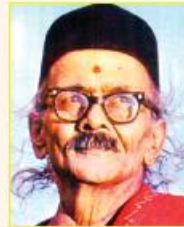
ಡಾ. ದ.ರಾ.ಬೇಂದ್ರೆ ಪಾಠಶಾಲೆ - 1973