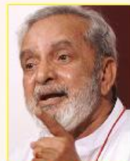
ಡಾ. ಯು.ಎಸ್.ನಾರಾಯಣ ಸಮಗ್ರ ಸಾಹಿತ್ಯ - 1994