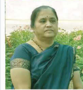
ಚರ್ಚೆ ನಡೆಸಿದ ಬಳಿಕ ಜರ್ಬೇರಾ ಹೂ ಬೇಸಾಯ ಕೈಗೊಳ್ಳಲು ನಿರ್ಧರಿಸಿದರು.