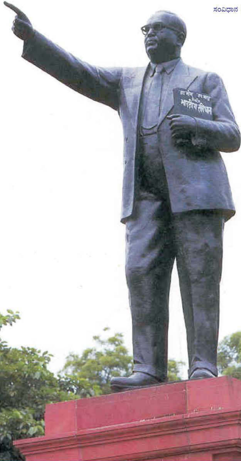
ಸಂವಿಧಾನ ಶಿಲ್ಪಿ ಡಾ. ಬಿ. ಆರ್. ಅಂಬೇಡ್ಕರ್