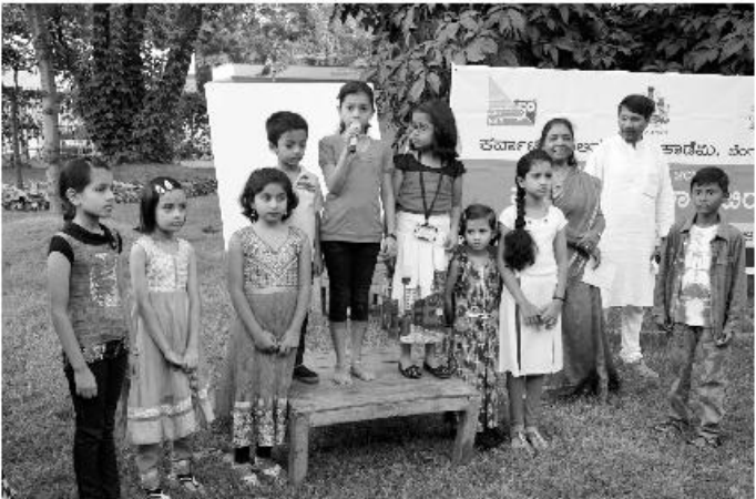
ಚಿಣ್ಣುರೂದಿಗೆ ಅಕಾಡೆಮಿ ಅಧ್ಯಕ್ಷರು ಮತ್ತು ರಿಜಿಸ್ಟ್ರಾರ್

ಬೆಂಗಳೂರಿನ ಸಾಂಸ್ಕೃತಿಕ ಹೆಗ್ಗುರುತೆನಿಸಿರುವ ರವೀಂದ್ರ ಕಲಾಕ್ಷೇತ್ರದ ಅಂಗಕದಲ್ಲರುವ ಶಿಲ್ಪವನದಲ್ಲ ಕರ್ನಾಟಕ ಲಲಿತಕಲಾ ಅಕಾಡೆಮಿಯ ಅಧ್ಯಕ್ಷರು, ರಿಜಿಸ್ಟ್ರಾರ್ ಮತ್ತು ಸಿಬ್ಬಂದಿಗಳು ಹಾಗೂ ಕಲಾಬಳಗದ ಸಮ್ಮುಖದಲ್ಲ ಮಕ್ಕಳು ಚಿತ್ರಣಿಸುವ ಮೂಲಕ ರಾಜ್ಯಾದ್ಯಂತದ ಮಕ್ಕಳ ಕಲಾ ತಿಬ್ಬರಕ್ಕೆ ವಿದ್ಯುಕ್ತ ಚಾಲನೆ ದೊರೆಯಿತು.