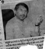
ಕಲಾ ಶಿಬಿರದ ಉದ್ಘಾಟನೆ ಕಾರ್ಯಕ್ರಮದ ಸಂದರ್ಭದಲ್ಲಿ

ಬೆಂಗಳೂರಿನಲ್ಲಿ ಶಿಬಿರದ ದಿನಗಳು ಕಲಾ ಶಿಬಿರದ ಉದ್ಘಾಟನೆ ಕಾರ್ಯಕ್ರಮದ ಸಂದರ್ಭದಲ್ಲಿ ಕಲಾ ಶಿಬಿರದ ಉದ್ಘಾಟನೆ ಕಾರ್ಯಕ್ರಮದ ಸಂದರ್ಭದಲ್ಲಿ ಕಲಾ ಶಿಬಿರದ ಉದ್ಘಾಟನೆ ಕಾರ್ಯಕ್ರಮದ ಸಂದರ್ಭದಲ್ಲಿ