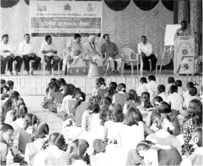
ಬೆಂಗಳೂರಿನಲ್ಲಿ ನಡೆದ ಮಕ್ಕಳ ಚಿತ್ರಕಲಾ ಶಿಬಿರದ ನೋಟ.