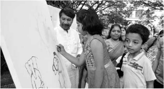
ಚಿತ್ರಗಿಡಿಸುವ ಮೂಲಕ ಮಕ್ಕಳೇ ತಿಬರಕ್ಕೆ ಚಾಲನೆ ನೀಡಿದ ಅಮರ್ಹಾ ಕ್ಷಣ.

ರಾಜ್ಯದ ಸಾವಿರಾರು ಕಲಾವಿದರು ಮೊಟ್ಟಮೊದಲ ಬಾರಿಗೆ ಅಕಾಡೆಮಿಯ ಈ ಎಲ್ಲಾ ಅವಕಾಶಗಳನ್ನು ಪಡೆದಿದ್ದಾರೆ. ಇಂತಹ ಪ್ರಗತಿಪರ ಕಾರ್ಯಚಟುವಟಿಕೆಗಳೊಂದಿಗೆ ಮಕ್ಕಳಲ್ಲಿ ದೃಶ್ಯಕಲಾ ಪ್ರಜ್ಞೆಯನ್ನು ಬೆಳೆಸುವ, ಸಂಚಲನಗೊಳಿಸುವ ನಿಟ್ಟಿನಲ್ಲಿ ಮೊಟ್ಟಮೊದಲ ಬಾರಿಗೆ ರಾಜ್ಯಾದ್ಯಂತ ಮಕ್ಕಳ ಕಲಾತಿಬರವನ್ನು ಆಯೋಜಿಸಿದ್ದು ವಿಶೇಷ.