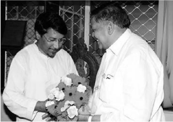
ಕರ್ನಾಟಕ ಲಲಿತಕಲಾ ಅಕಾಡೆಮಿಗೆ ಅಪರೂಪದ ಅತಿಥಿಗಳಾಗಿ ಭೇಟಿ ನೀಡಿದ ಆಂಧ್ರಪ್ರದೇಶದ ಸಭಾಪತಿಗಳಿಗೆ ಅಕಾಡೆಮಿ ಅಧ್ಯಕ್ಷರಿಂದ ಆದರದ ಸ್ವಾಗತ.

ಕೆ.ಲೆ. ಸಾಹಿತ್ಯ ಮತ್ತು ಸಂಸ್ಕೃತಿ ಹರಿಯುವ ನದಿಯಂತೆ, ಪ್ರಕೃತಿಯಂತೆ ಅನಂತ. ಪೀಳಿಗೆಯಿಂದ ಪೀಳಿಗೆಗೆ, ಜನಾಂಗದಿಂದ ಜನಾಂಗಕ್ಕೆ ದಾಟಿಸಲ್ಪಡುವ ಕೆ.ಲೆ, ಸಾಹಿತ್ಯ ಮತ್ತು ಸಂಸ್ಕೃತಿಗೆ ಜಾತಿ, ಮತ, ಧರ್ಮ, ಪಂಥ, ಪ್ರಾಂತ್ಯಗಳ ಭೇದವಿಲ್ಲ. ಎಲ್ಲೆಡೆ ಎಲ್ಲೆಲ್ಲೆಯೂ ಇರುವಂತಹುದು.