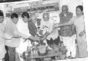
ಅನಾಥರ ಕೆ ಸಿದ್ಧಿಗಾಗಿ ಲಾಭಕರವಾದ, 2 ಚಕ್ರಗಳನ್ನು 20 ಎಂ.ಎಸ್.ಎಂ.ಎಸ್. ಹಾಗೂ ಸಾ.ಸಿ.ಪಿ.ಎಸ್.ಗಳಿಂದ, ಕಲಾಪಿ ಪ್ರ. ಸಿ. ಸಿದ್ಧಿಗಾಗಿ ಚಕ್ರಗಳನ್ನು