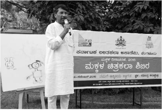
ಅಕಾಡೆಮಿ ಅಧ್ಯಕ್ಷರಿಂದ ಮಕ್ಕಳಿಗೆ ಹಿತವಚನ

ಮಕ್ಕಳ ಕಲಾತಿಬ್ಬರವು ಯಾವುದೇ ತಾರತಮ್ಯವಿಲ್ಲದೇ ನಾಡಿನ ಮಕ್ಕಳ ಮನಸ್ಸನ್ನು ಆರೋಗ್ಯವಾಗಿ ಬೆಳೆಸುವ ದೃಶ್ಯಕಲಾ ಪ್ರಜ್ಞೆಯನ್ನು ಮುಕ್ತವಾಗಿ ಅಭಿವ್ಯಕ್ತಗೊಳಿಸುವ ವೇದಿಕೆಯಾಗಿ ಹೊಸ ಪೀಳಿಗೆಯ ಚಿಗುರು ಪ್ರತಿಭೆಗಳಿಗೆ ಬಲು ಉಪಯುಕ್ತವಾಯಿತು.