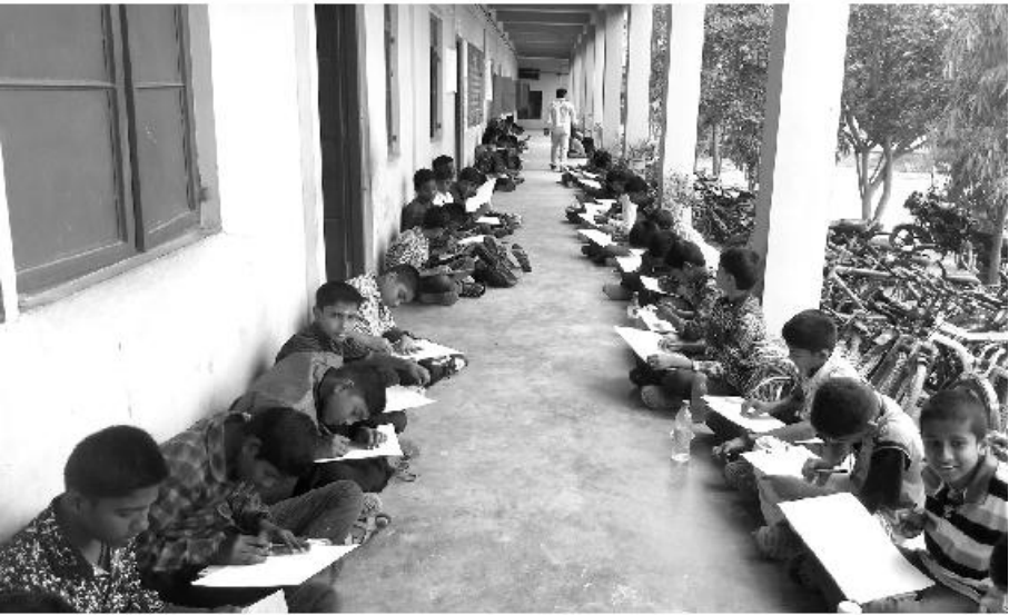
ಚಾಮರಾಜನಗರದಲ್ಲಿ ಚಿತ್ರರಚನೆಯಲ್ಲಿ ಮಕ್ಕಳ ತನ್ಮಯತೆ.