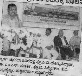
ಉದ್ಘಾಟನೆ ಸಂದರ್ಭದಲ್ಲಿ ಉದ್ಘಾಟನೆಗೆ ಉದ್ದೇಶಿಸಿ ವಾಣಿಜ್ಯ ಎಂಬ ಉದ್ದೇಶದಿಂದ ಈ ಸಂದರ್ಭದಲ್ಲಿ ಉದ್ಘಾಟನೆ ನಡೆಯಿತು.

ವಿಷಯವಾಗಿ ಸಿದ್ಧಿಗಾಗಿ ಉದ್ಘಾಟನೆಗೆ ಉದ್ದೇಶಿಸಿ ವಾಣಿಜ್ಯ ಎಂಬ ಉದ್ದೇಶದಿಂದ ಈ ಸಂದರ್ಭದಲ್ಲಿ ಉದ್ಘಾಟನೆ ನಡೆಯಿತು. ಅಧಿಕಾರಿಗಳ ಪಾಲ್ಗೊಳ್ಳುವಂತೆ ವಾಣಿಜ್ಯ ಎಂಬ ಉದ್ದೇಶದಿಂದ ಈ ಸಂದರ್ಭದಲ್ಲಿ ಉದ್ಘಾಟನೆ ನಡೆಯಿತು.