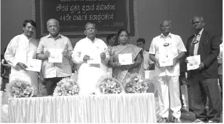
ವಾರ್ಷಿಕ ಪ್ರಶಸ್ತಿ ಪ್ರದಾನ ಸಮಾರಂಭದಲ್ಲಿ ಅಕಾಡೆಮಿಯ ಕ್ಯಾಟ್‌ಲಾಕ್ ಬಿಡುಗಡೆಯ ಸಂದರ್ಭ.