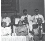
ಪ್ರಶಸ್ತಿ ಪ್ರದಾನ ಕರವಾರಂಭದಲ್ಲಿ ಗೌರವ ಪ್ರಶಸ್ತಿ, ಕಾರ್ತವೀರ್ಯ ಸೈನ್ಯ ಮೂಲಕ ಪ್ರದಾನ.

ಪ್ರಶಸ್ತಿ ಪ್ರದಾನ ಕರವಾರಂಭದಲ್ಲಿ ಗೌರವ ಪ್ರಶಸ್ತಿ, ಕಾರ್ತವೀರ್ಯ ಸೈನ್ಯ ಮೂಲಕ ಪ್ರದಾನ. ಪ್ರಶಸ್ತಿ ಪ್ರದಾನ ಕರವಾರಂಭದಲ್ಲಿ ಗೌರವ ಪ್ರಶಸ್ತಿ, ಕಾರ್ತವೀರ್ಯ ಸೈನ್ಯ ಮೂಲಕ ಪ್ರದಾನ.