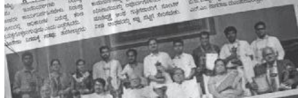
ಬಾಗಲಕೋಟೆ ಸಂಸ್ಥೆಯ ಆಯೋಜನೆ... ಲಲಿತಕಲೆ ಸಂಸ್ಥೆಯ ಆಯೋಜನೆ... ಬಾಗಲಕೋಟೆ ಸಂಸ್ಥೆಯ ಆಯೋಜನೆ...