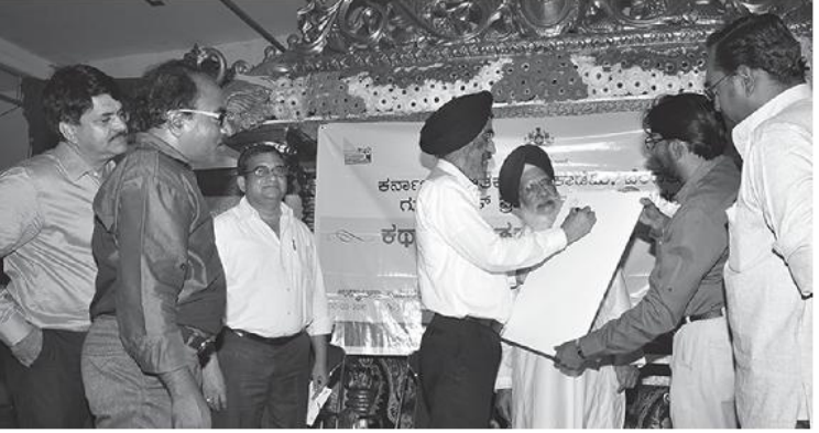
ಶಿಬಿರಕ್ಕೆ ಚಾಲನೆ ದೊರೆತ ಸಂದರ್ಭದಲ್ಲಿ ಅತಿಥಿ ಗಣ್ಯರಿಂದ ಚಿತ್ರ ರಚನೆ.