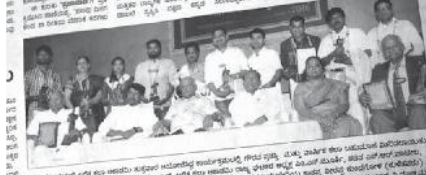
ಬಾಗಲಕೋಟೆ ಸಂಸ್ಥೆಯ ಆಯೋಜನೆ... ಲಲಿತಕಲೆ ಸಂಸ್ಥೆಯ ಆಯೋಜನೆ... ಬಾಗಲಕೋಟೆ ಸಂಸ್ಥೆಯ ಆಯೋಜನೆ...