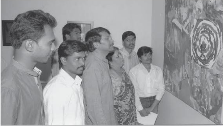
ಯುವಪ್ರತಿಭೆಗಳ ಕಲಾಕೃತಿಗಳ ವಿಕ್ಷಣಿಯಲ್ಲಿ ತಲ್ಲೀನವಾಗಿರುವ ಅತಿಥಿ ಗಣ್ಯರು, ಅಕಾಡೆಮಿ ಅಧ್ಯಕ್ಷರು ಮತ್ತು ಕಲಾವಿದರು