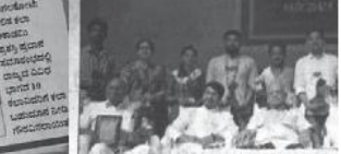
ಬಾಗಲಕೋಟೆ ಸಂಸ್ಥೆಯ ಆಯೋಜನೆ... ಲಲಿತಕಲೆ ಸಂಸ್ಥೆಯ ಆಯೋಜನೆ... ಬಾಗಲಕೋಟೆ ಸಂಸ್ಥೆಯ ಆಯೋಜನೆ...