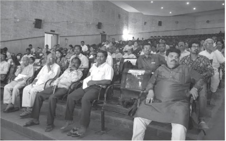
ಅಕಾಡೆಮಿಯ ವಾರ್ಷಿಕ ಪ್ರಶಸ್ತಿ ಪ್ರಧಾನ ಸಮಾರಂಭವನ್ನು ಸಂಪನ್ನಗೊಳಿಸಿದ ಪ್ರೇಕ್ಷಕ ಮತ್ತು ಕಲಾವಿದ ಸಮೂಹ

ಕಳೆದ ವರ್ಷ ಅಕಾಡೆಮಿಯ ಗೌರವ ಪ್ರಶಸ್ತಿ ಪ್ರದಾನದ ಸಂದರ್ಭದಲ್ಲಿ ಅಕಾಡೆಮಿ ಅಧ್ಯಕ್ಷರು ಪ್ರಸ್ತಾಪಿಸಿ ಮಂಡಿಸಿದ ಹಕ್ಕೂತ್ತಾಯದ ಫಲವಾಗಿ ಸರ್ಕಾರ ಅಕಾಡೆಮಿಯ ಗೌರವ ಪ್ರಶಸ್ತಿಯ ಮೊತ್ತವನ್ನು ಹತ್ತು ಸಾವಿರ ರೂಪಾಯಿಯಿಂದ ಐವತ್ತು ಸಾವಿರ ರೂಪಾಯಿಗೆ ಹಾಗೂ ವಾರ್ಷಿಕ ಬಹುಮಾನದ ಮೊತ್ತವನ್ನು ಐದು ಸಾವಿರ ರೂಪಾಯಿಯಿಂದ ಇಪ್ಪತ್ತೈದು ಸಾವಿರ ರೂಪಾಯಿಗೆ ಹೆಚ್ಚಿಸಿದ್ದು ಈ ಬಾರಿ ಆ ಮೊತ್ತವನ್ನು ವಿತರಿಸಿದ್ದು ವಿಶೇಷವಾಗಿತ್ತು.