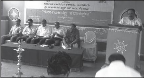
ಕಮ್ಮಟದಲ್ಲಿ ವಿಷಯತಜ್ಞರಿಂದ ವಿಚಾರಮಂಡನೆ.