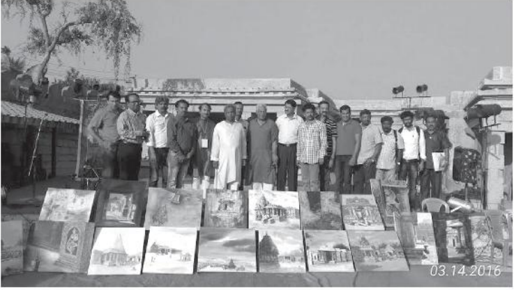
'ಲಕ್ಷ್ಮೇಶ್ವರ ದೃಶ್ಯ ವರ್ಧಿ' ಚಿತ್ರಕಲಾ ಶಿಬಿರಕ್ಕೆ ಭೇಟಿ ನೀಡಿದ ಪದ್ಮಶ್ರೀ ಪುರಸ್ಕೃತ ಹಿಂದೂಸ್ತಾನಿ ಗಾಯಕ ಪಂಡಿತ್ ವೆಂಕಟೇಶ್‌ಕುಮಾರ್ ಅವರೊಟ್ಟಿಗೆ ಶಿಬಿರದ ಕಲಾವಿದರು.